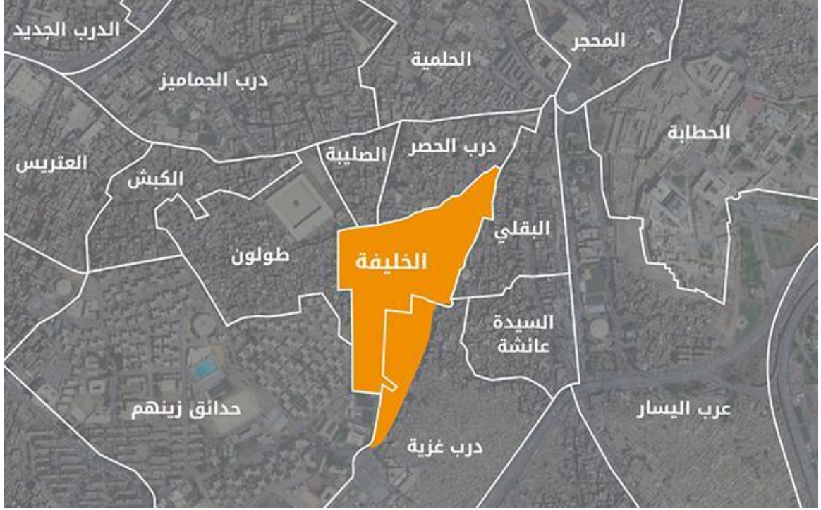
حقوق النشر: حي الخليفة- تضامن 49