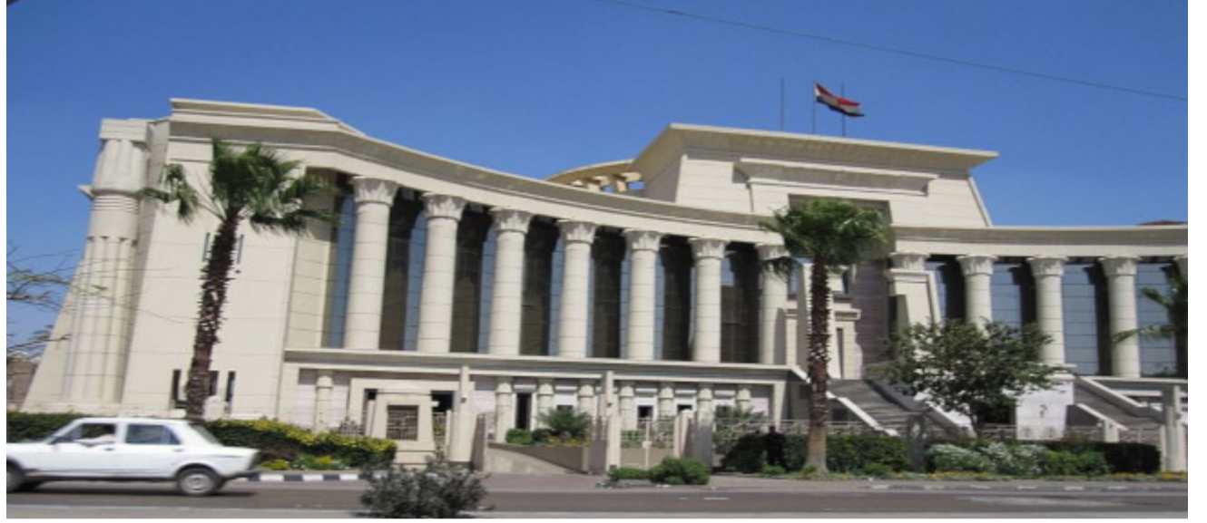
Egypt's Supreme Constitutional Court, located in the Cairo suburb of Maadi.