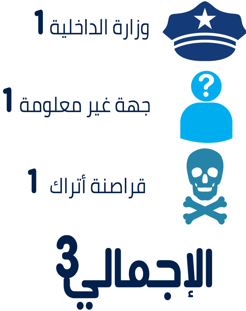
شكل رقم (6) توزيع الانتهاكات وفقاً لجهة المعتدي

تم رصد انتهاك لكل من وزارة الداخلية، وقراصنة أتراك، وجهة غير معلومة.