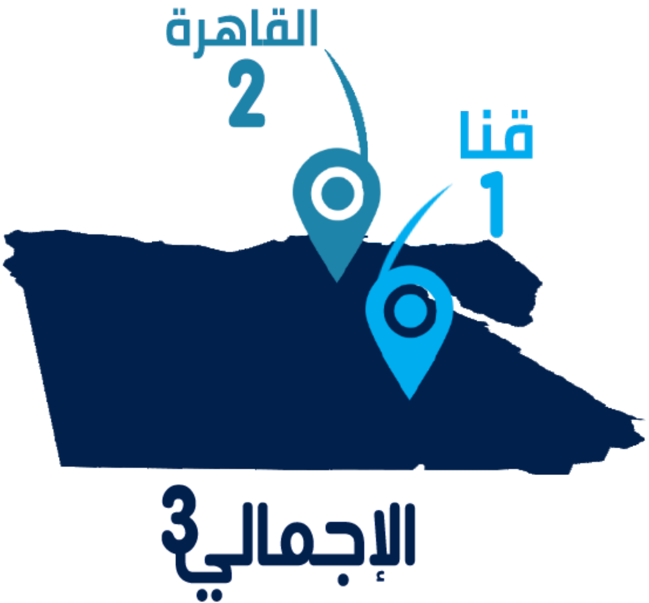
شكل رقم (7) توزيع الانتهاكات وفقاً للنطاق الجغرافي

على الصعيد الجغرافي، سجلت الوحدة عدد (3) حالات انتهاك خلال يونيو 2019 بواقع حالتين في محافظة القاهرة، مقابل حالة بمحافظة قنا.