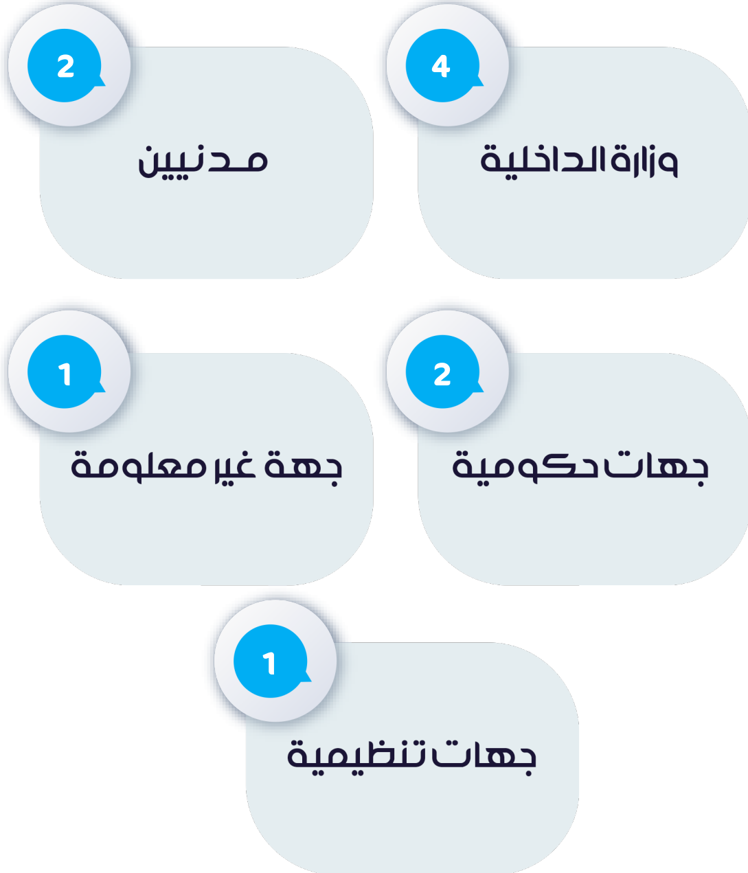
شكل رقم (6) توزيع الانتهاكات وفقاً لجهة المعتدي

ومن حيث جهات الاعتداء؛ جاءت في المرتبة الأولى وزارة الداخلية بواقع 4 انتهاكات، تلاها أفراد مدنيين، وجهات قضائية، بواقع حالتان، وفي المرتبة الثالثة جاءت كلاً من جهات غير معلومة، والجهات التنظيمية المسؤولة عن تنظيم المشهد الصحفي الإعلامي، بواقع واحدة لكل منهما.