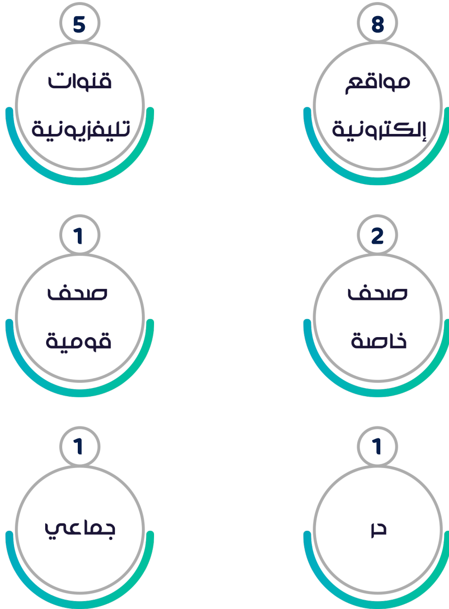
شكل رقم (4) توزيع الانتهاكات وفقاً لجهة عمل الصحفي/ة أو الإعلامي/ة

سجل برنامج الرصد والتوثيق بالمؤسسة، 18 حالة انتهاك منها 8 حالات بحق عاملين في مواقع إلكترونية، و5 حالات بحق عاملين بقنوات تليفزيونية، بينما سجل المرصد حالتين بحق عاملين بصحفي خاصة، وكذلك حالة واحدة بحق كلٍ من؛ عامل بصحيفة قومية، وصحفي حر، بالإضافة إلى حالة واحدة وقعت بشكلٍ جماعي.