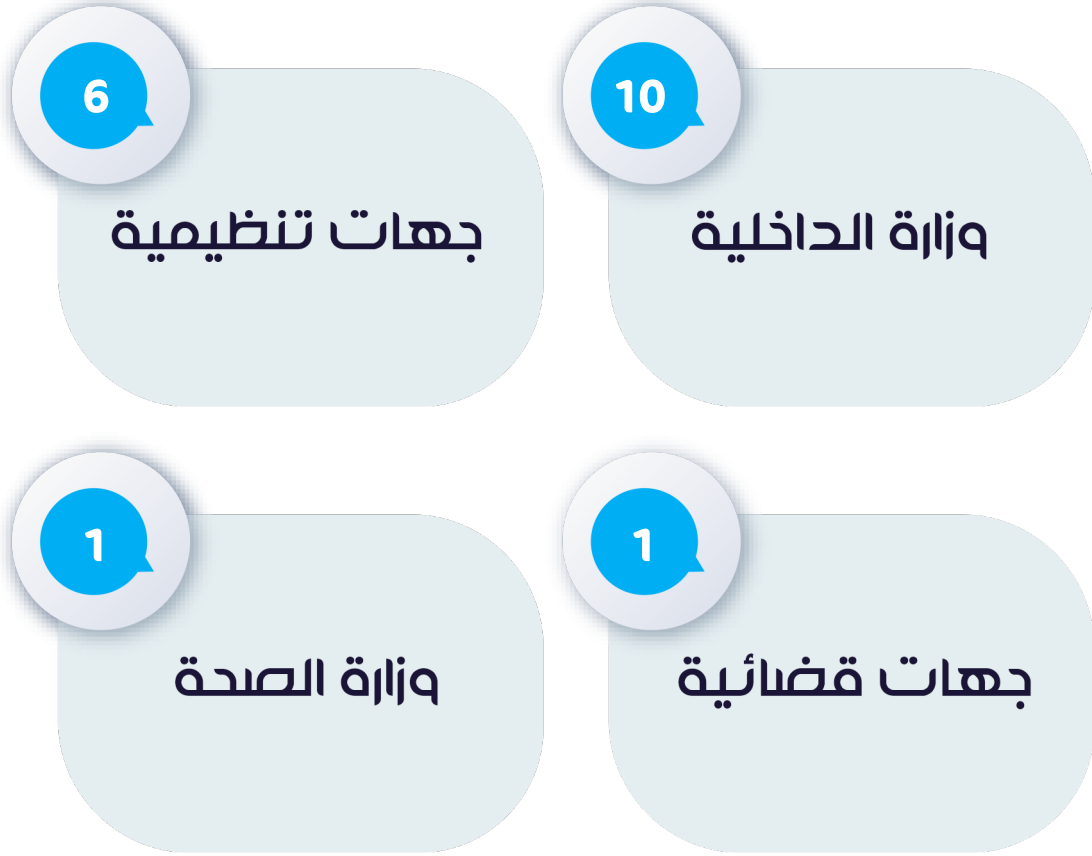
شكل رقم (6) توزيع الانتهاكات وفقاً لجهة المعتدي

ومن حيث جهات الاعتداء؛ جاءت في المرتبة الأولى وزارة الداخلية بواقع 10 حالات انتهاك، تلتها الجهات التنظيمية المسؤولة عن تنظيم المشهد الصحفي والإعلامي بواقع 6 حالات، وفي المرتبة الثالثة جاءت كل من جهات قضائية، ووزارة الصحة، بحالة واحدة لكل منهما.