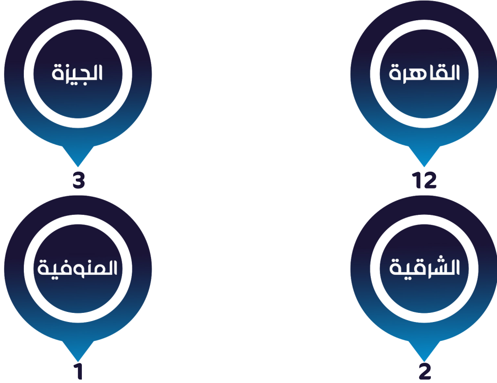
شكل رقم (7) توزيع الانتهاكات وفقاً للنطاق الجغرافي

على الصعيد الجغرافي؛ سجل "المرصد" عدد 18 حالة انتهاك، خلال يونيو 2020، بواقع 12 حالة بالعاصمة القاهرة، و3 حالات بمحافظة الجيزة، وحالتين بمحافظة الشرقية، وحالة واحدة بمحافظة المنوفية.