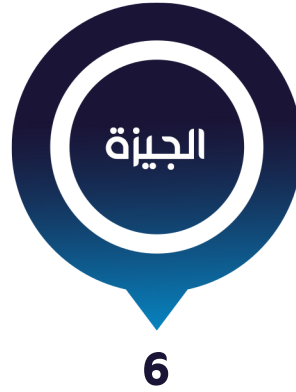
شكل رقم (7) توزيع الانتهاكات وفقاً للنطاق الجغرافي