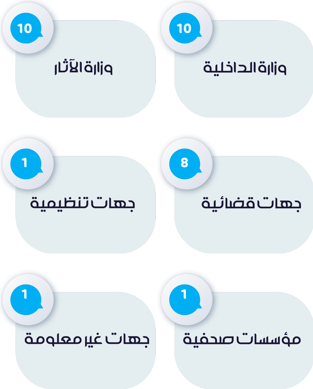
شكل رقم (6) توزيع الانتهاكات وفقاً لجهة المعتدي

من حيث جهات الاعتداء؛ جاءت في المرتبة الأولى وزارتي الداخلية والآثار بواقع (10) حالات انتهاك قام بها كلاً منهما ونسبة حوالي 32.2% لكل منهما من إجمالي الانتهاكات، تلتها الجهات القضائية بواقع (8) حالات انتهاك ونسبة حوالي 25.8% من إجمالي الانتهاكات، وأخيراً جاءت الجهات التنظيمية والمؤسسات الصحفية وجهات غير معلومة بحالة وحدة ونسبة 3.2% لكل منهم.