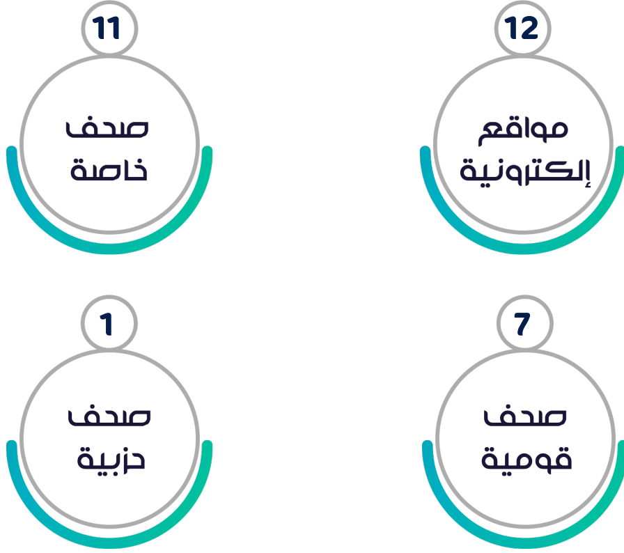
شكل رقم (4) توزيع الانتهاكات وفقاً لجهة عمل الصحفي/ة أو الإعلامي/ة

سجل "المرصد" وقائع لعدد من الصحفيين/الإعلاميين العاملين بقطاعات إعلامية مختلفة؛ بواقع عدد (12) حالة انتهاك بحق عاملين بمواقع إلكترونية بنسبة حوالي 38.7% من إجمالي الانتهاكات، وعدد (11) حالة انتهاك بحق عاملين بصحف خاصة بنسبة حوالي 35.5% من إجمالي الانتهاكات، و(7) حالات بحق عاملين بصحف قومية بنسبة حوالي 22.6% من إجمالي الانتهاكات. وحالة واحدة بحق عاملين بصحف حزبية بنسبة حوالي 3.2% من إجمالي الانتهاكات.