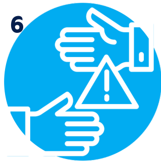
توثيق غير مباشر

سجل برنامج الرصد والتوثيق بـ "المرصد" عدد (31) حالة انتهاك خلال شهر نوفمبر 2020, تم توثيق (25) حالة عن طريق التوثيق المباشر مع ضحايا الانتهاكات بما نسبته حوالي (80.6%) من إجمالي الانتهاكات, و(6) انتهاكات عن طريق التوثيق غير المباشر عبر الجهات الصحفية بما يمثل حوالي 19.4% من إجمالي الانتهاكات.