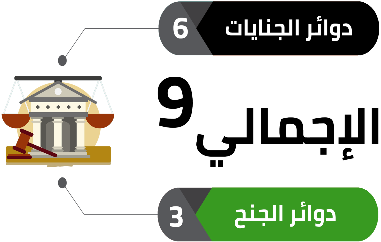
شكل رقم (3) يوضح تصنيف قضايا الصحفيين/ات والإعلاميين/ات وفقاً للجهة المنظور أمامها القضية المرصد المصري للصحافة والإعلام

كانت دوائر الجنايات الأكثر عددًا في نظر القضايا، حيث بلغ عدد القضايا المنظورة أمامها 6 قضايا بنسبة 67% من إجمالي عدد القضايا، وتلاها في المرتبة الثانية دوائر العمال والتي نظرت 3 قضايا بنسبة 33% من إجمالي عدد القضايا.