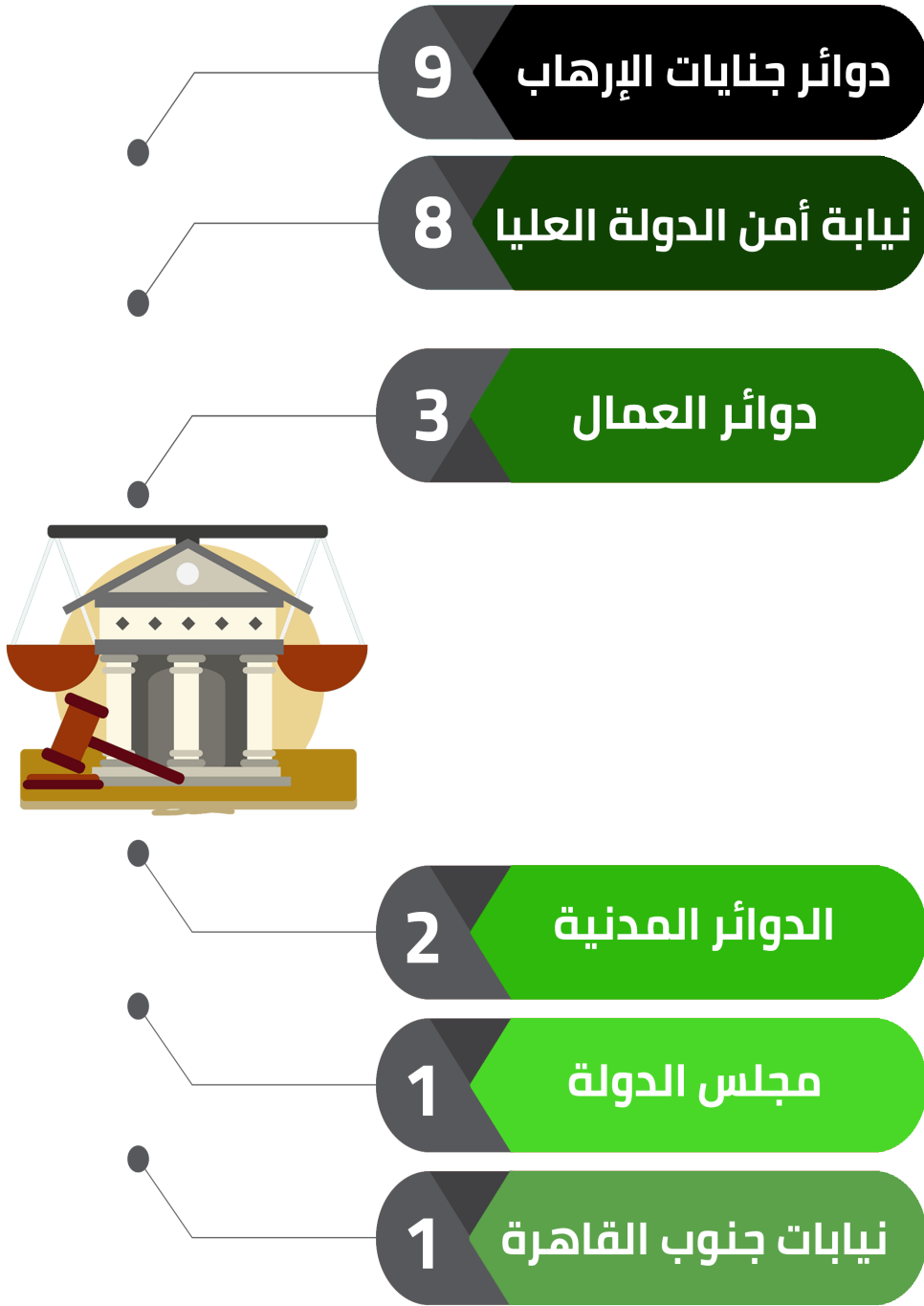
شكل رقم (3) يوضح تصنيف قضايا الصحفيين/ات والإعلاميين/ات وفقاً للجهة المنظور أمامها القضية

جاءت بالمرتبة الأولى دوائر جنایات الإرهاب والتي نظرت 9 قضايا بنسبة 37.5% من إجمالي القضايا، وفي المرتبة الثانية نيابة أمن الدولة العليا والتي نظرت 8 قضايا بنسبة حوالي 33.3% من إجمالي القضايا، وفي المرتبة الثالثة دوائر العمال والتي نظرت 3 قضايا بنسبة 12.5% من إجمالي القضايا، ثم تليها في المرتبة الرابعة الدوائر المدنية والتي نظرت قضيتان بنسبة حوالي 8.33% من إجمالي القضايا، وأخيراً جاء كلاً من مجلس الدولة ونيابات جنوب القاهرة، ونظر كلاً منهما قضية واحدة، بنسبة حوالي 4.16% من إجمالي القضايا.