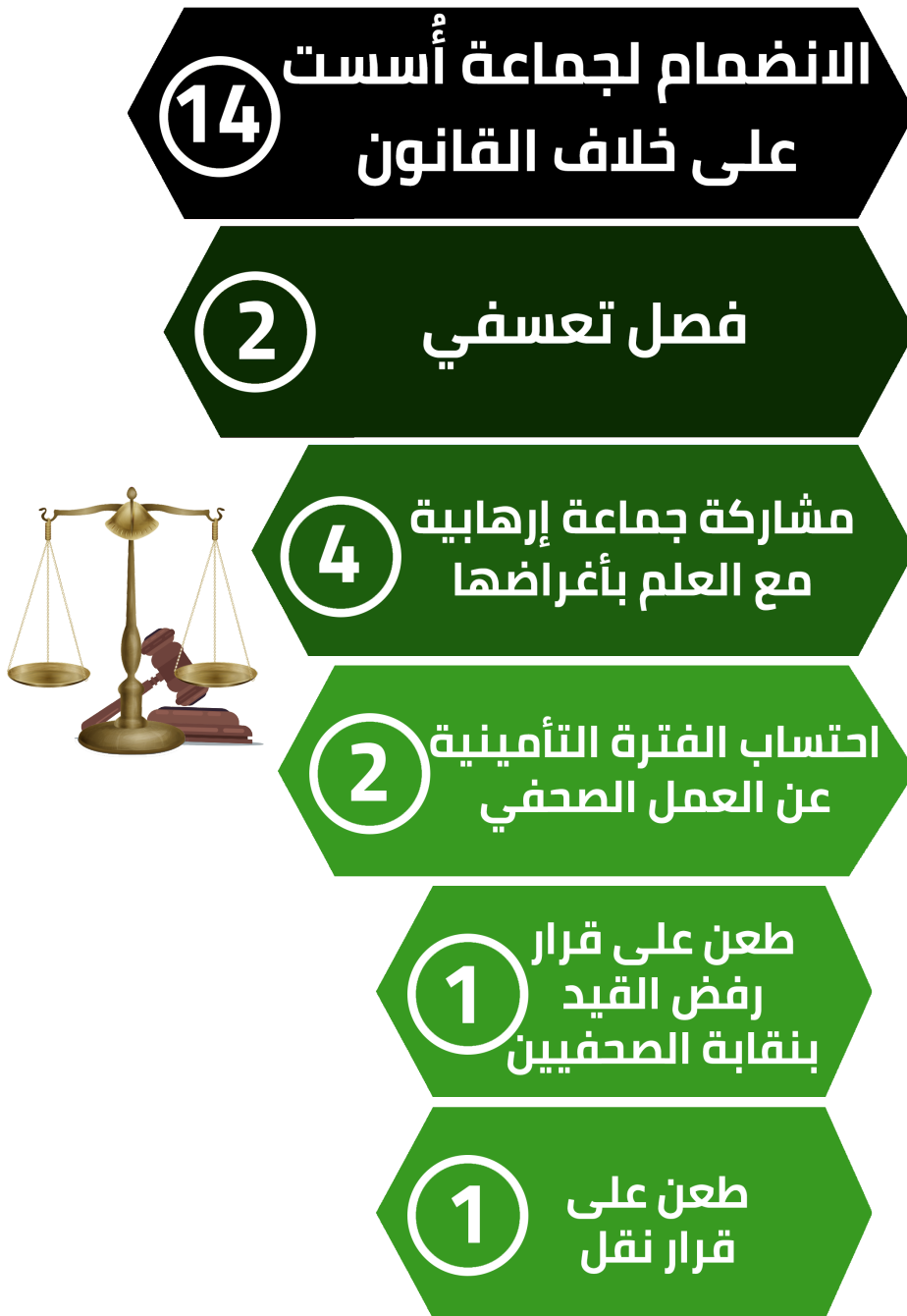
شكل رقم (2) يوضح تصنيف قضايا الصحفيين/ات والإعلاميين/ات وفقاً لنوع القضية

يمكن تصنيف القضايا السابقة وفقًا لنوع القضية، فنجد أن قضايا الانضمام لجماعة أُسست على خلاف أحكام الدستور وبث ونشر الأخبار الكاذبة، قد احتلت المرتبة الأولى حيث بلغت نسبة القضايا حوالي 58.33% من إجمالي القضايا بواقع 14 قضية، وبالمرتبة الثانية نجد الاتهام بمشاركة جماعة إرهابية مع العلم بأغراضها بنسبة حوالي 16.66% بواقع 4 قضايا من إجمالي القضايا، والمرتبة الثالثة يحتلها بالتساوي كلاً من الفصل التعسفي والمطالبة باحتساب الفترة التأمينية عن العمل الصحفي بنسبة حوالي 8.33% بواقع قضيتان لكلاً منهما من إجمالي القضايا، وجاء بالمرتبة الأخيرة كلاً من الطعن على قرار رفض القيد بنقابة الصحفيين، والطعن على قرار نقل، بنسبة بلغت حوالي 4.16% بواقع قضية واحدة لكلاً منهما.