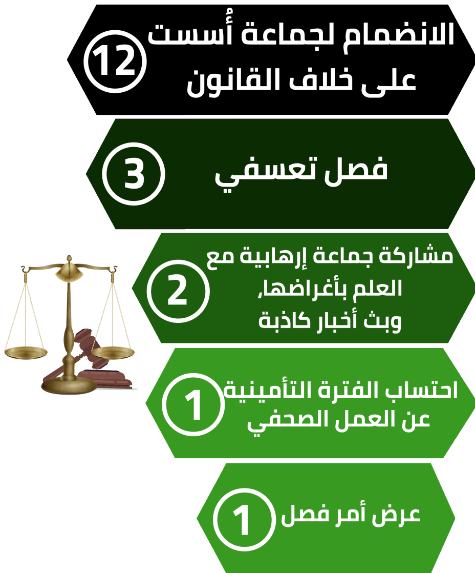
شكل رقم (2) يوضح تصنيف قضايا الصحفيين/ات والإعلاميين/ات وفقاً لنوع القضية

يمكن تصنيف القضايا السابقة وفقاً لنوع القضية، فنجد أن قضايا الانضمام لجماعة أُسست على خلاف أحكام الدستور وبث ونشر الأخبار الكاذبة، قد احتلت المرتبة الأولى حيث بلغت نسبة القضايا حوالي 63.1% من إجمالي القضايا بواقع 12 قضية، وبالمرتبة الثانية نجد قضايا الفصل التعسفي حيث بلغت نسبتها 15.7% بواقع 3 قضايا، وفي المرتبة الثالثة جاءت قضية الاتهام بمشاركة جماعة إرهابية مع العلم بأغراضها ونشر أخبار كاذبة بنسبة حوالي 10.5% بواقع قضيتين من إجمالي القضايا، والمرتبة الرابعة ضمت قضية احتساب الفترة التأمينية عن العمل الصحفي، وقضية عرض أمر الفصل بنسبة 5.2% لكل منهما بواقع قضية لكل واحدة من إجمالي القضايا.